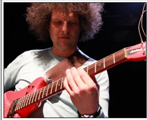
Thomas Maos • Foto, Thomas Maos

Thomas Maos - http://www.elektrogitarre.de/