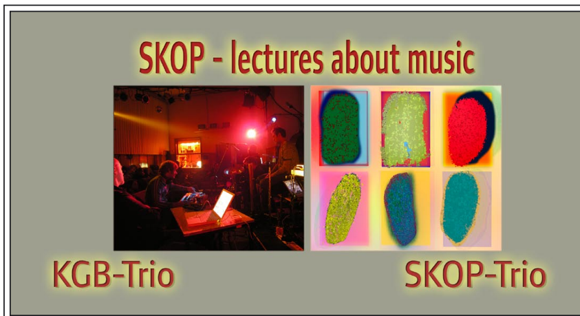
Einladungskarte - lectures about music • SKOP 2006

Lectures about music, so der Titel unserer nächsten Veranstaltung. Es stellen sich an diesem Abend zwei Trios, das KGB-Trio und das SKOP-Trio mit ihrer Kompositionsweise vor. Nach einem ca. halbstündigen Vortrag wird das jeweilige Trio eine Komposition vortragen.